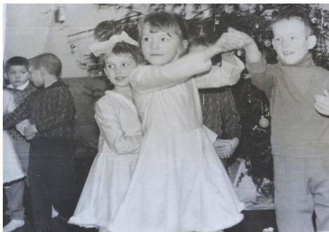
Узнали? Это я...